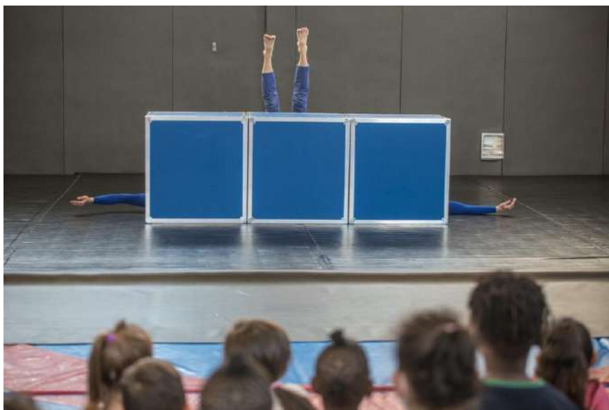
Version tout terrain - ci-dessus en Dojo / Sol tatami et tapis de danse / gradinage avec tapis et banc