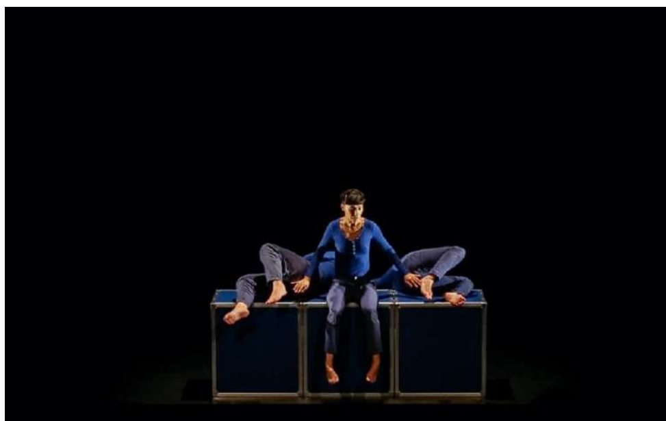
Version Théâtre - ci-dessus au Théâtre de Corbeil Essonne avec installation lumière légère