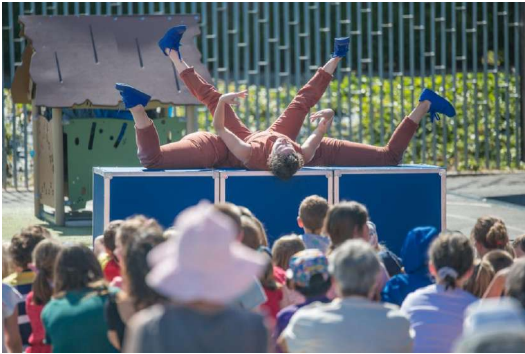
Festival sortie de Bain à Granville - dans une cour d'école Sur béton + moquette + tapis de danse / assise public : moquettes et chaises